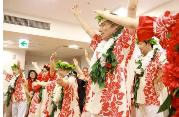
利用者によるフラダンス、日頃の練習の成果を発揮して大好評でした！！