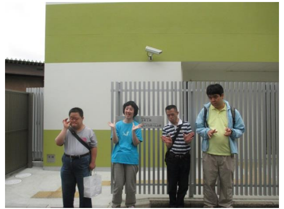
訪問したからには、とりあえず記念撮影ですね★