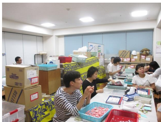
1階の上町工房にもお邪魔しました。避難訓練を終え、またお仕事に戻られるところでした。軽やかに手を動かしながら時折楽しげにお話をされ、皆さん笑顔でした。