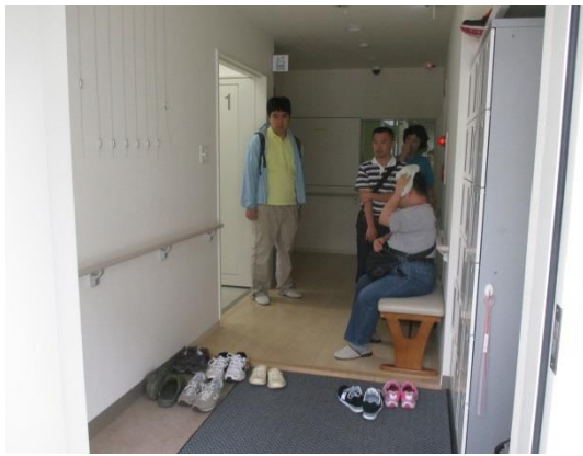
入口です。ロッカーも下駄箱も使いやすいです。