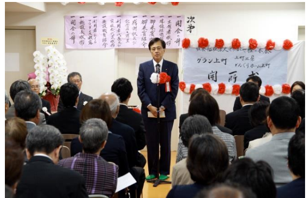
当日は保坂区長からもご挨拶を頂きました。その他にも多くの方にお越し頂きました。