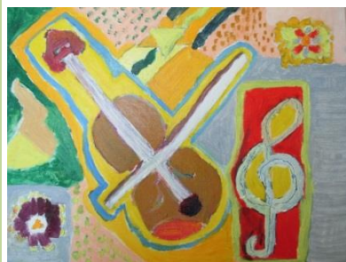
高嶋未知子さん作