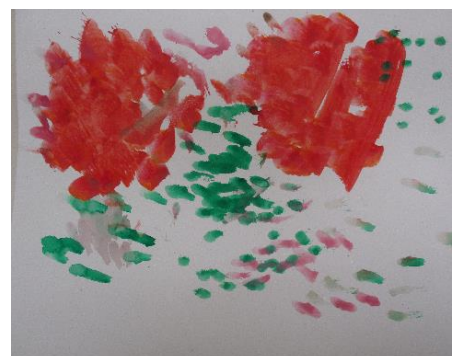
富岡亜由美さん作